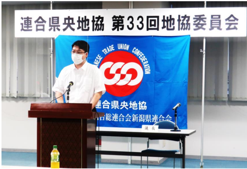
開会のあいさつは熊谷副議長（東北電力労組）